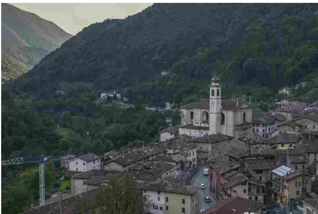
Dall'alto. Il piccolo borgo

«L'Italia può essere un leader nella valorizzazione delle aree rurali nel mondo e una guida per altri paesi che